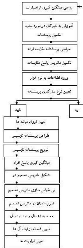
نمودار الگوریتم اجرای تحقیق