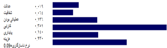
نرخ سازگاری پرسشنامه

برای تأیید پایایی پرسشنامه AHP از نرخ سازگاری پرسشنامه‌های AHP استفاده می‌شود. در صورتی که این نرخ کمتر از ۰/۱ باشد، سازگاری پرسشنامه تأیید و داده‌های آن قابل اتکا می‌باشد.