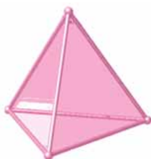
شکل ۲- مدل اولیه یک شبکه همکار شامل ۴ عضو

هر وجه نوع و وظیفه آن وجه را مشخص می‌کند. به عنوان مثال وجهی از منشور که ضلع‌های تشکیل دهنده آن بیشتر مدیریتی باشند وظیفه مدیریت کار و پروژه را بر عهده می‌گیرد و شرکت تشکیل دهنده آن وجه به عنوان مدیر پروژه معرفی می‌گردد. گروهی از شرکت‌ها که ضلع آنها در وجه شرکت مدیر می‌باشد، کارگروه مدیریتی پروژه را تشکیل می‌دهند. به همین ترتیب، کمیته‌های حقوقی، فنی، بازرگانی، مالی، اجرایی و ... تشکیل می‌گردند و کار بین وجوه منشور تقسیم می‌شود. بر اساس مدل ارائه شده مشخص شدن توانایی‌ها و ویژگی‌های شرکت‌ها در گام اول مهمترین و اصلی‌ترین عامل ایجاد یک شبکه همکار قوی و موفق است. در تشخیص تجربه و تخصص معیارهای خوبی وجود دارد، اما آنچه مسئله‌ساز است مدیریت است. شرکت‌های همکار باید دارای مدیریت دانش محور و نوین باشند، مدیریتی که تعریفی از کار گروهی داشته باشد.